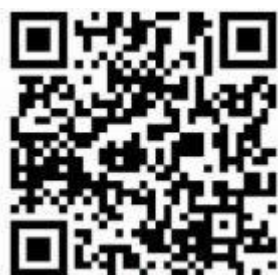
信用中国信用修复流程二维码